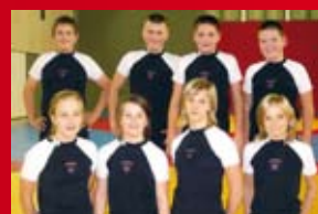
LUTTE OLYMPIQUE 12/14 ans