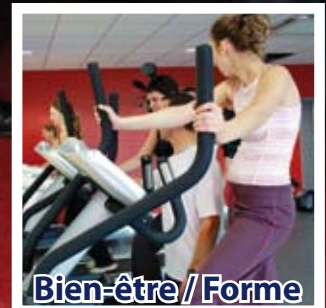
Bien-être / Forme