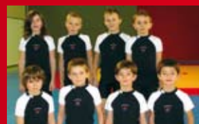
LUTTE JEUNE 7/10 ans