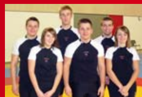
LUTTE OLYMPIQUE +15 ans

lundi, mercredi et vendredi de 19h à 20h30